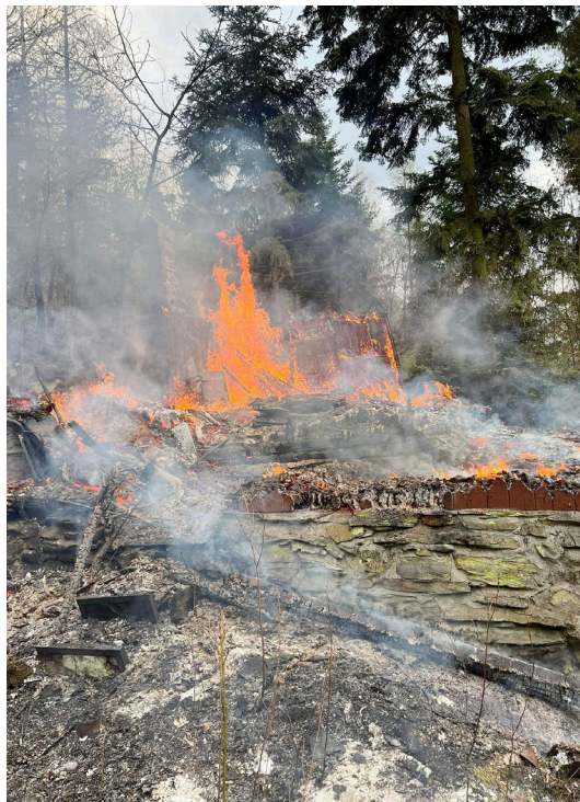
» Požár lesní chatky u potoka ve Zlatém dole.