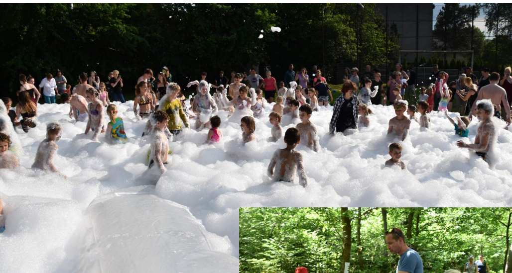
» Dětský den s pohádkovou cestou 2022