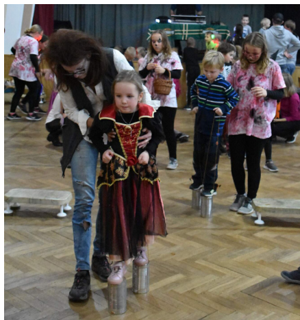
» Halloween Lošov 2022